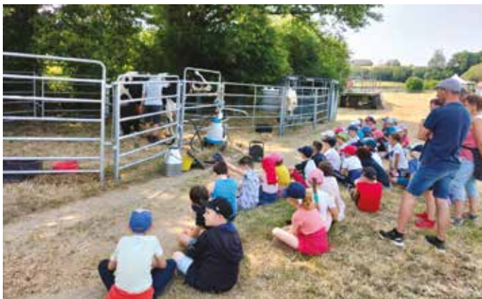
Pendant l'AG, les enfants de Martigné étaient conviés par les adhérents à une animation avec la traite d'une vache.